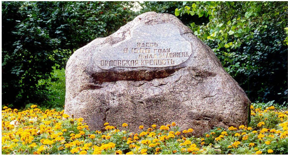
Вид Орловской крепости